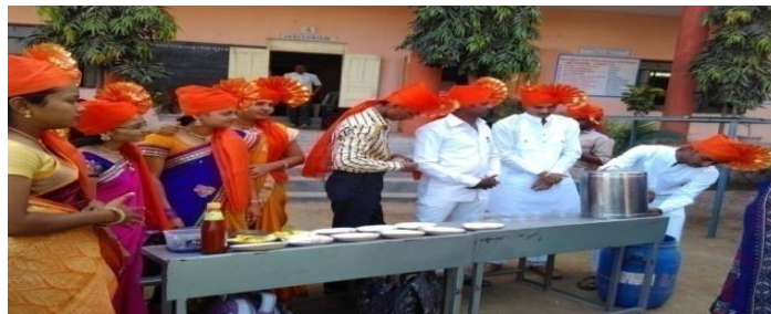
Traditional dress Competition