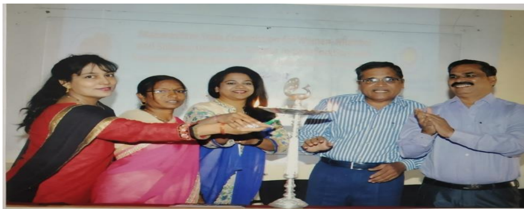
Workshop on Implementation of Awareness and Prevention from Sexual Harassment on 27/2/2017