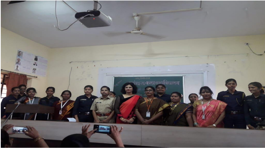
माताचा व दामिनी पथकाचा सन्मान