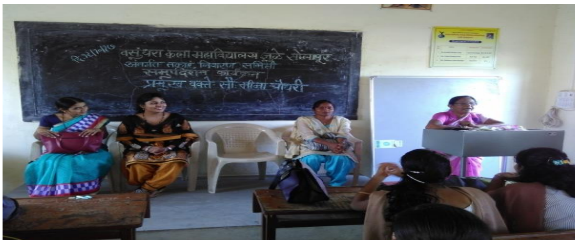
Counselling Programme on gender sensitization for Students