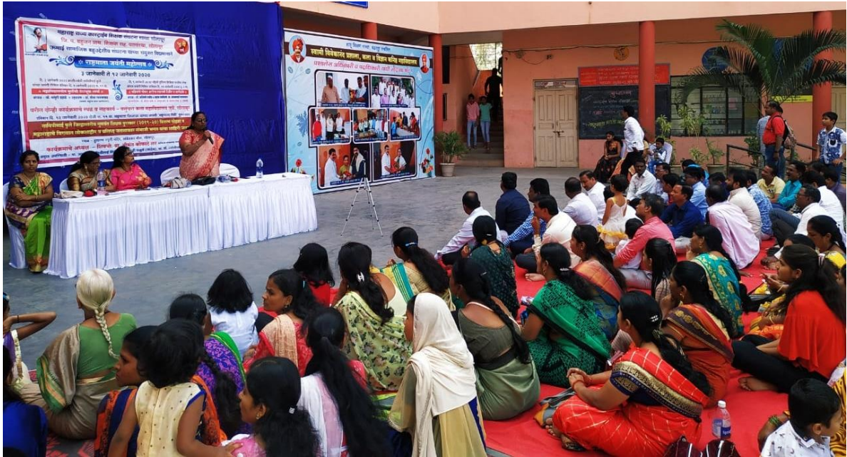
Societies Women Traditional Dress Utsav