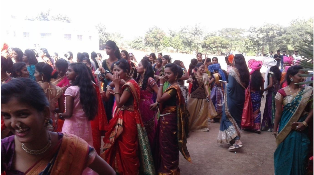
Traditional Dress Utsav