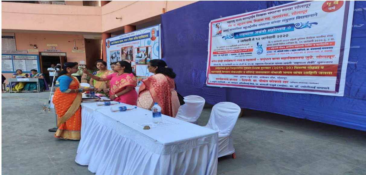
Castraib Teacher Association, Primary Teacher Corporate Path Sanstha, Umai Samjik Bahu-Uddeshiy Sanghatana & Vasundhara College.